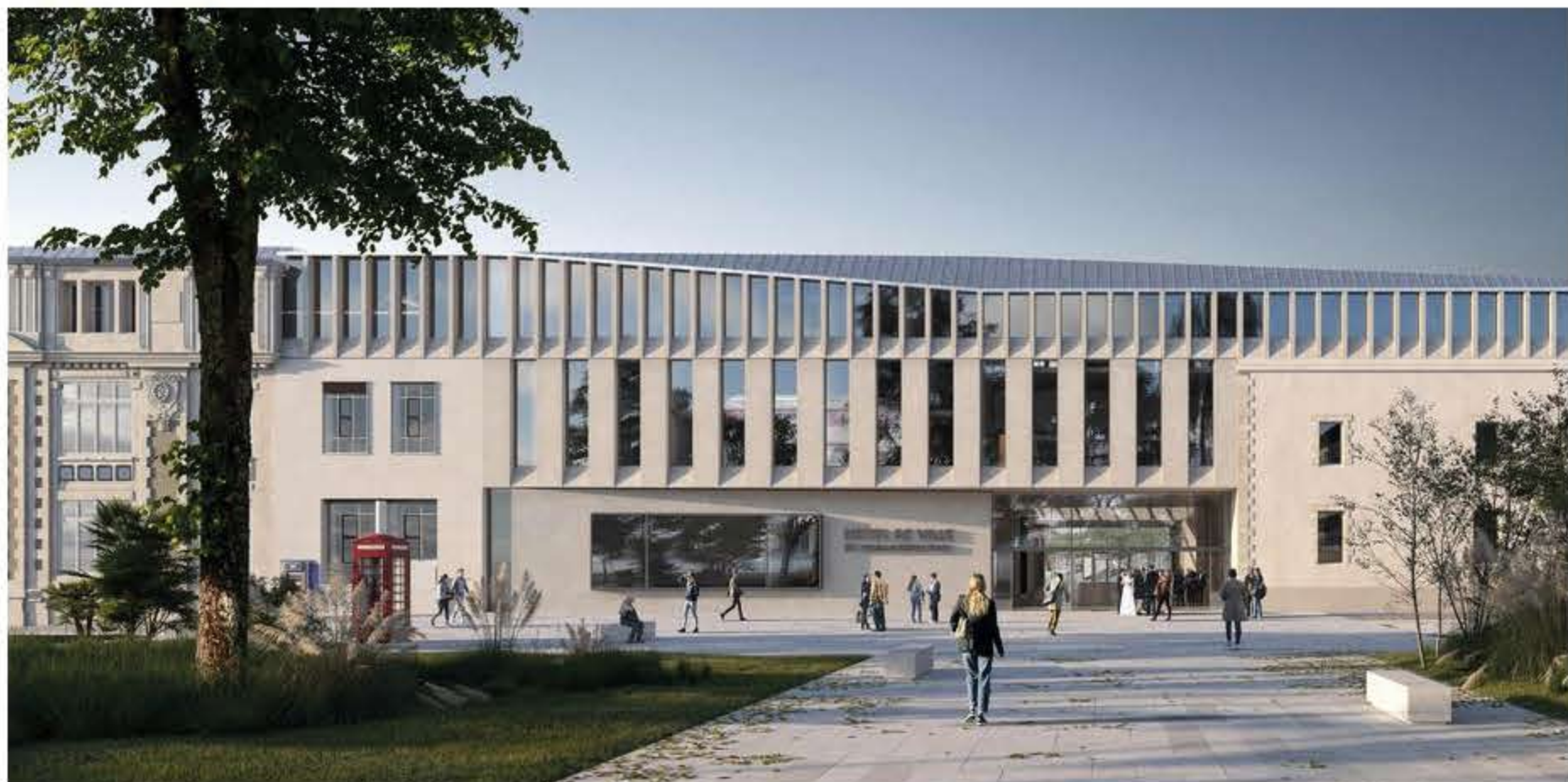
L'entrée du futur carré de l'Hôtel de Ville se fera rue Georges-Clemenceau. (©Agence Richez et associés)

Après un an de consultation, la Ville de La Roche-sur-Yon a enfin trouvé son architecte. Le groupement parisien Richez Associés a remporté le chantier de construction du futur carré de l'Hôtel de Ville et d'Agglomération et du nouveau musée-espace Napoléon.