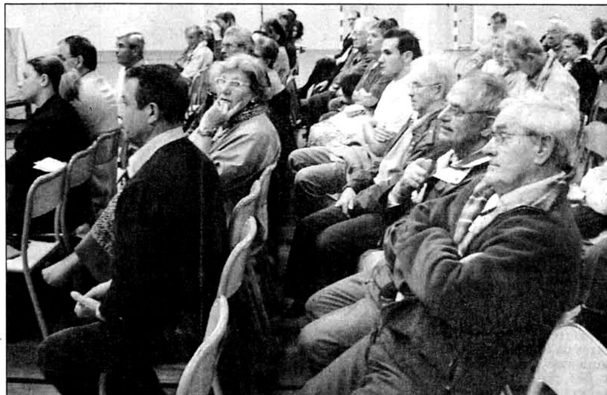
La « communauté de l'anneau » (les riverains du Vélodrome) totalement à l'écoute.

Une qualité de cheminement, des espaces mieux gérés, une surface doublée pour les piétons : c'est tout cela, le futur Vélodrome. Sans oublier tout de même 30.000 véhicules par jour qui tourneront autour de l'anneau, le besoin de stationnement, les commerçants... ! Des informations supplémentaires à découvrir dans notre édition de demain.