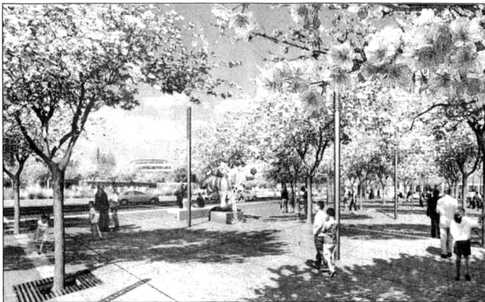
Sur un espace piéton confortable, la future place sera arborisée de cerisiers à fleurs et d'éléments d'eau (petites fontaines). Perspectives DUBUS RICHARD