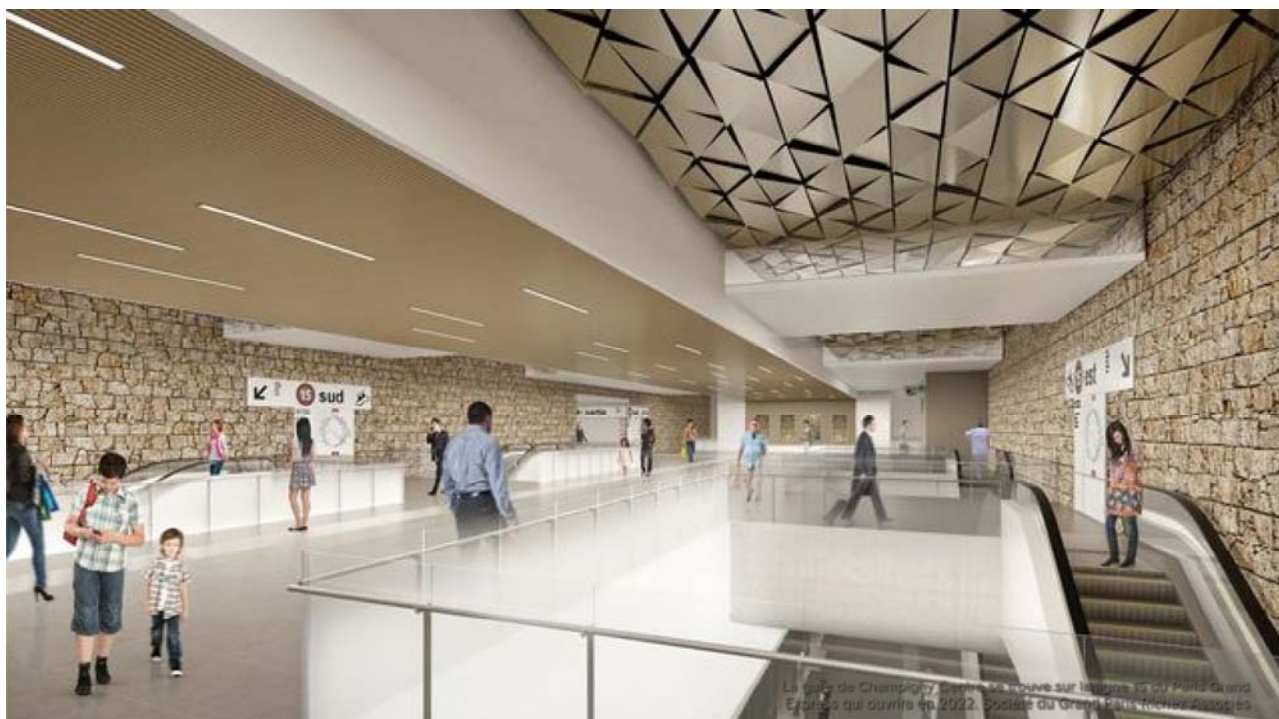
La gare de Champigny Centre se trouve sur la ligne 15 du Paris Grand Express qui ouvre en 2022. Société du Grand Paris/Architectes