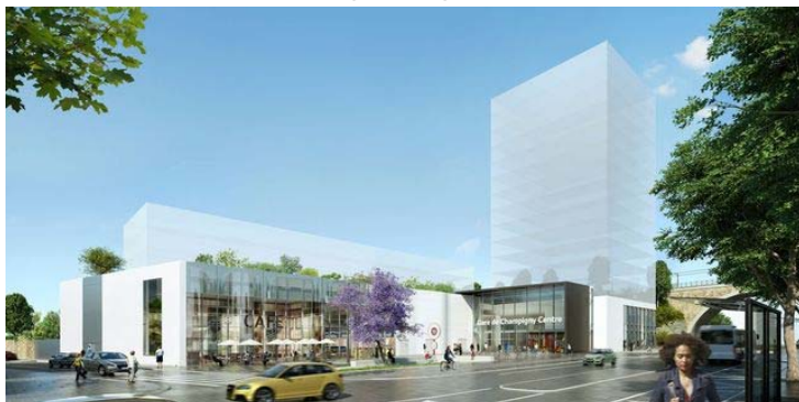
Côté Ouest de la gare. Société du Grand Paris-Richez Associés

Il existe également un projet de musée entre la gare et la Marne, musée qui sera dédié à la mémoire de la Résistance. Champigny a été un lieu fort de résistance, particulièrement