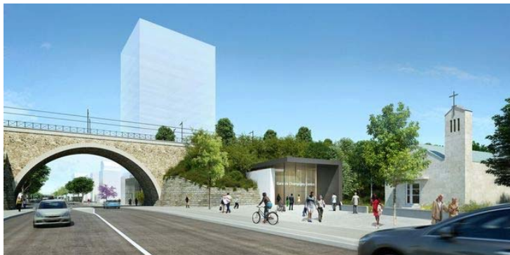
Côté Est de la gare. Société du Grand Paris-Richez Associés

La gare s'inscrit dans un lieu fort de la Résistance