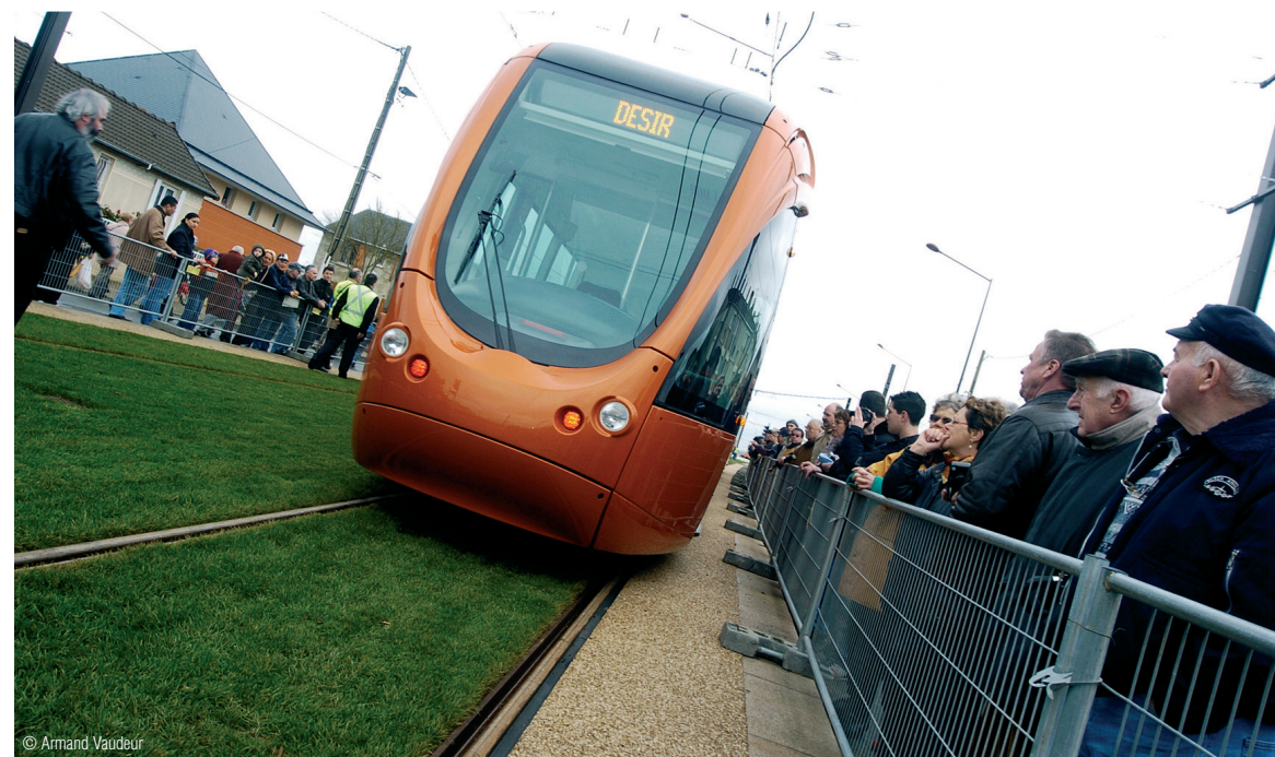
... sous les yeux et les applaudissements d'un bon millier de curieux.

teront les noms des autres communes de Le Mans Métropole mais aussi de personnages historiques célèbres." ■