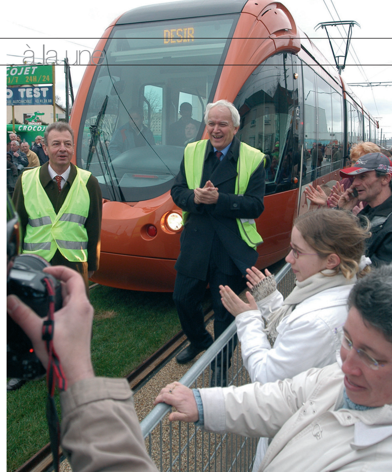
Désir, la première rame du tramway a effectué sa sortie inaugurale, le 23 février, sans encombres...