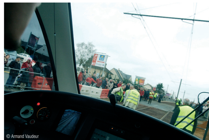
Vue de la cabine de pilotage...